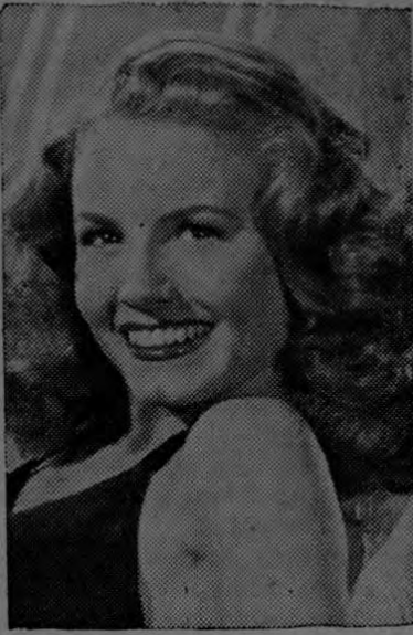
Max Factor Jr., experto de Hollywood en belleza femenina, declara que aún la belleza natural de mujeres tan lindas como JANET BLAIR, estrella de Columbia Studios, gana considerablemente con una alegre sonrisa.

Hasta hace algún tiempo se había generalizado la costumbre de no usar colorete porque muchas creían que el empleo del Pan-Cake no lo