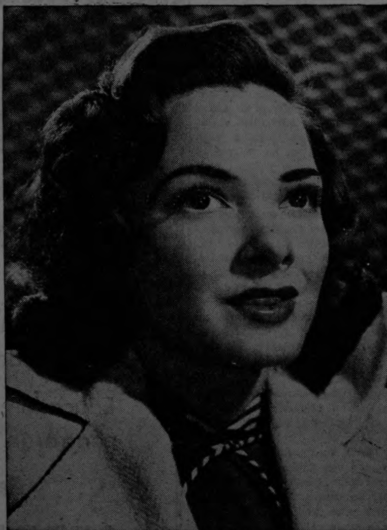
KATHRYN GRAYSON... Estrella de la Metro Goldwyn Mayer

Cantar es parte de la personalidad de Kathryn Grayson.